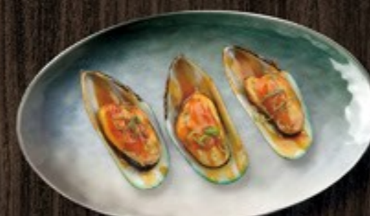
108. Mosselen mosselen