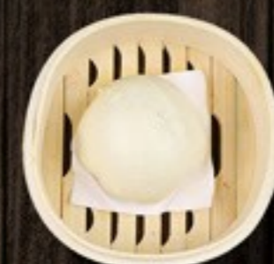
78. Sweet Bun puddingbroodje