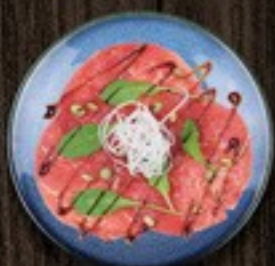
55. Japanese Beef Carpaccio carpaccio, rettich & Japanese dressing