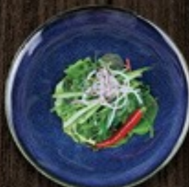
57. Seaweed zeewier, komkommer & rettich