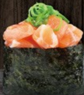
30. Salmon zalm