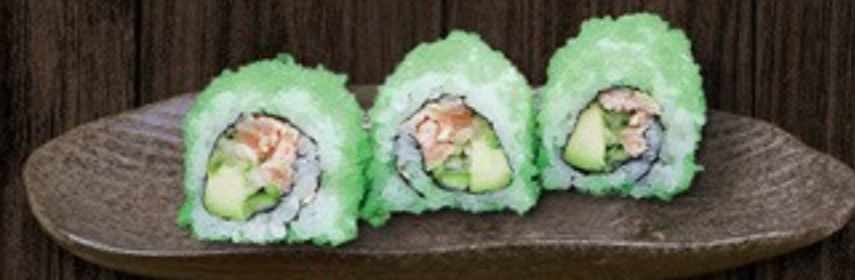
45. Wasabi Sake pikante zalm & avocado