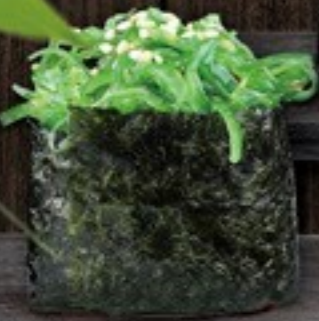
33. Seaweed zeewier