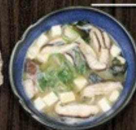
65. Miso Soup sojabonen soep