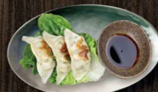
107. Gyoza Japanese kippasteitjes