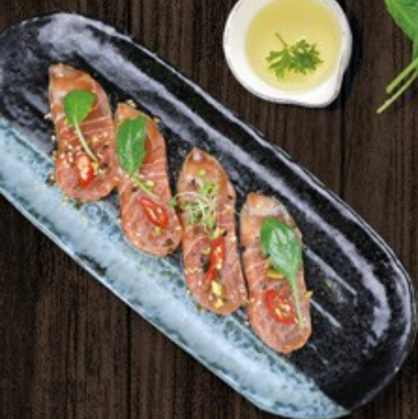
50. Sashimi Salmon zalm sashimi, ponzu & piscache noten