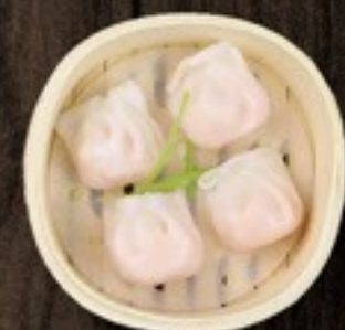
76. Ha Kau garnaal in deeg