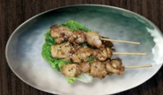
106. Yakitori kipspiesjes