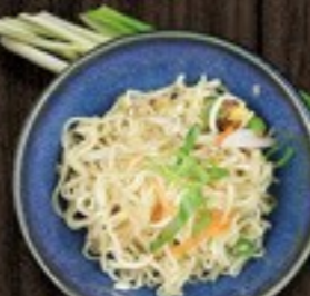
69. Fried Noodles gebakken noedels