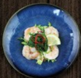
53. Thai Gamba garnalen met zoetzuur saus