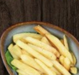
72. Chips frietjes