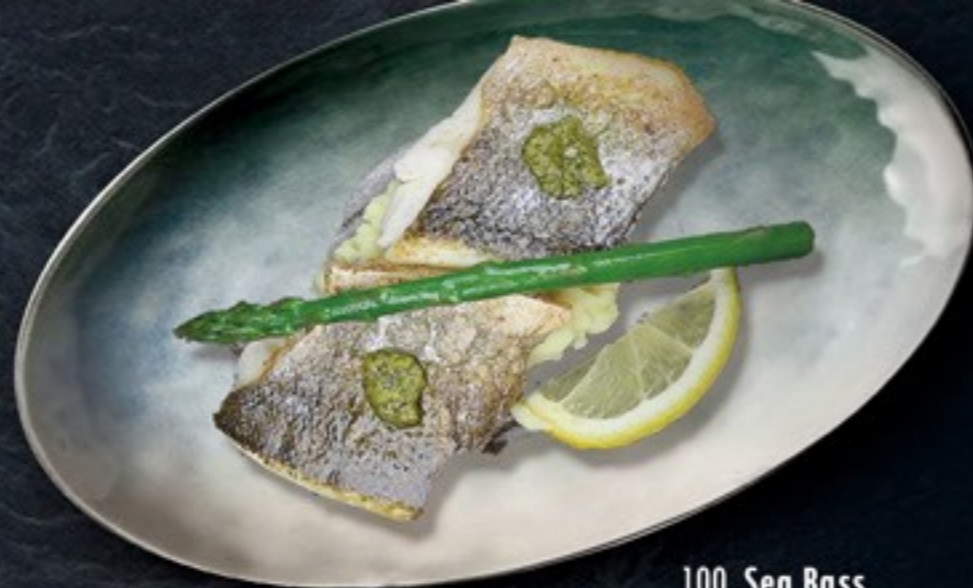
100. Sea Bass zeebaars met pestosaus