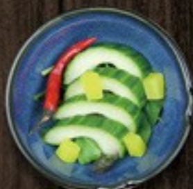
58. Oshinko Cucumber oshinko & komkommer