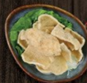
67. Cassava Chips pikante kroepoek