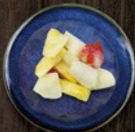
60. Fruitmix vruchten & kokossaus