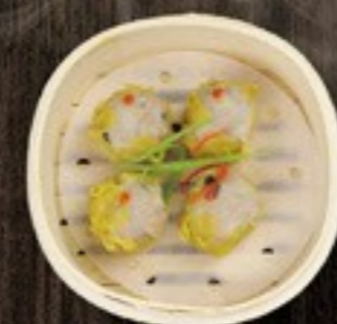
77. Siu mai varkensgehakt in deeg