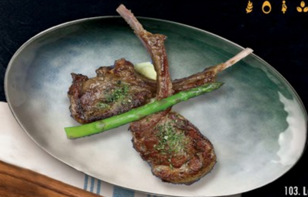
103. Lamb Rack lamskotelet met zwarte pepersaus en gesnipperd zeewier