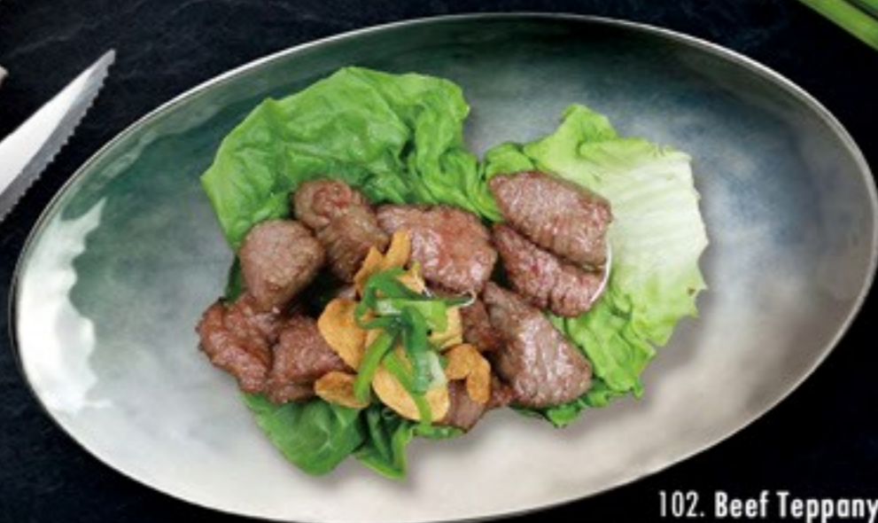
102. Beef Teppanyaki biefstukjes met gedroogde knoflookvlokken