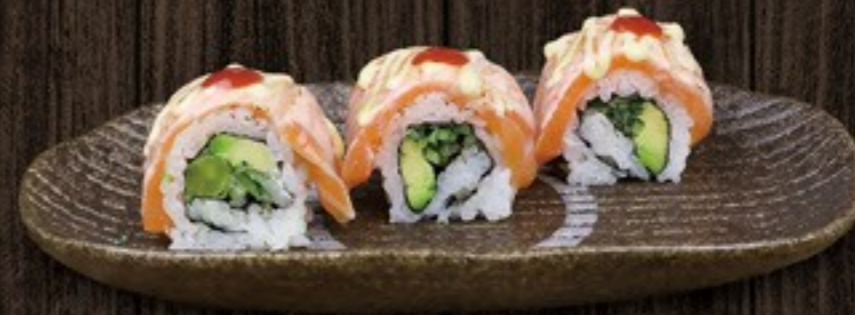
43. Flambe Salmon gegrilde zalm & sriracha mayonaise