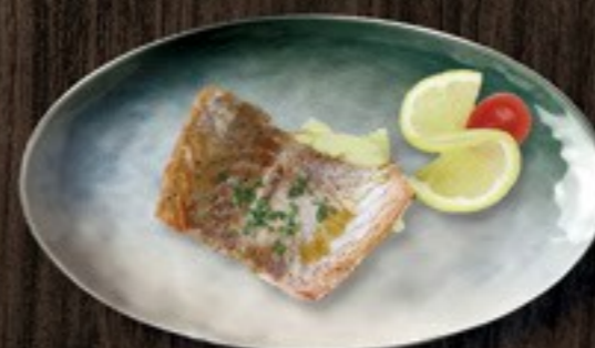
104. Miso Salmon zalm in miso dressing