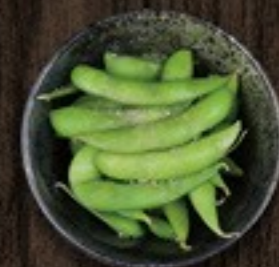
68. Edamame sojabonen