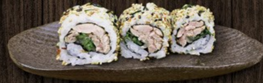
44. Grilled tuna gegrilde tonijn & komkommer