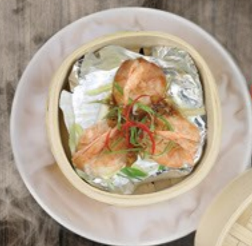
75. Steamed Soy Shrimps gestoomde garnalen met sojasaus