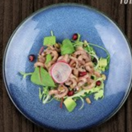
52. Shrimp Cocktail garnalencocktail, avocado en pijnboompitten