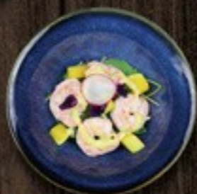
54. Mango Shrimps garnalen, mango & vioolblaadjes