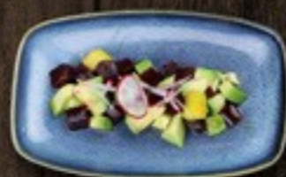
56. Yuzu Avocado avocado, rode bieten, radijs & yuzu dressing