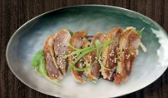
105. Duck Breast eendenborstfilet