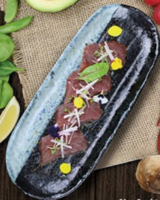
51. Sashimi Tuna tonijn sashimi, ponzu & radijs