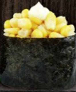
32. Maïs maïs