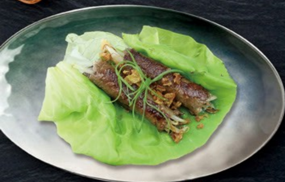
101. Usuyaki biefrolletjes