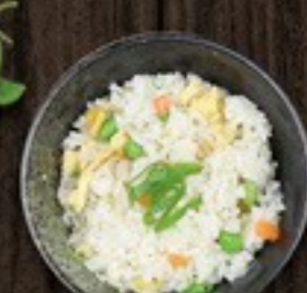
70. Fried Rice gebakken rijst