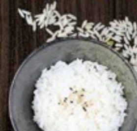
71. White Rice witte rijst