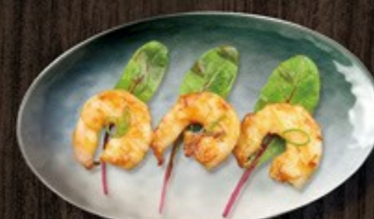
109. Ebi Yaki gamba's