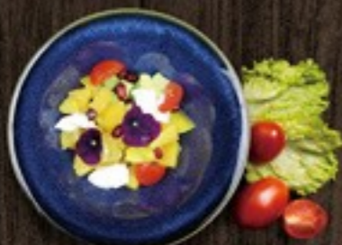
59. Veggie Rainbow mango, sinaasappel, avocado tomaat met yoghurt dressing